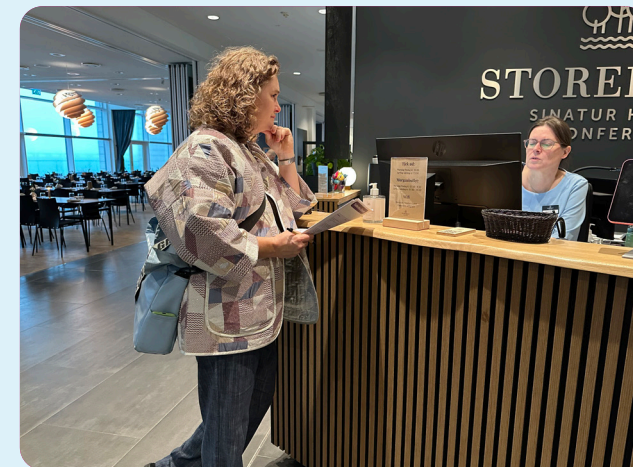
Turisme for Alle-screening - Sinatur Storebælt

Endelig blev der i 2025 igangsat to demonstrations- og rådgivningsforløb inden for social bæredygtighed i vores møde- og erhvervsturisme. Her samarbejder vi med Sinatur Storebælt og Sinatur Sixtus, som begge udvikler og tester nye tiltag, der styrker deres sociale ansvar i drift, organisation og gæsteoplevelser. Formålet er at skabe konkrete, praktiske løsninger – og samle erfaringer, der kan inspirere resten af branchen.